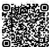
QR Code สิ่งที่ส่งมาด้วย ๑

รายงานการวิจัยฉบับสมบูรณ์ รูปแบบการจัดการเรียนรู้ที่เสริมสร้าง ทักษะการเรียนรู้แบบนำตนเองเชิง สร้างสรรค์