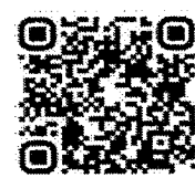
QR Code สิ่งที่ส่งมาด้วย ๓

วิดิทัศน์การเรียนการสอน แบบนำตนเองเชิงสร้างสรรค์