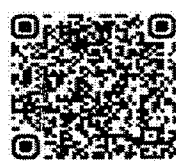
QR Code สิ่งที่ส่งมาด้วย ๒

เอกสาร รูปแบบการจัดการเรียนรู้ ที่เสริมสร้างทักษะการเรียนรู้แบบ นำตนเองเชิงสร้างสรรค์